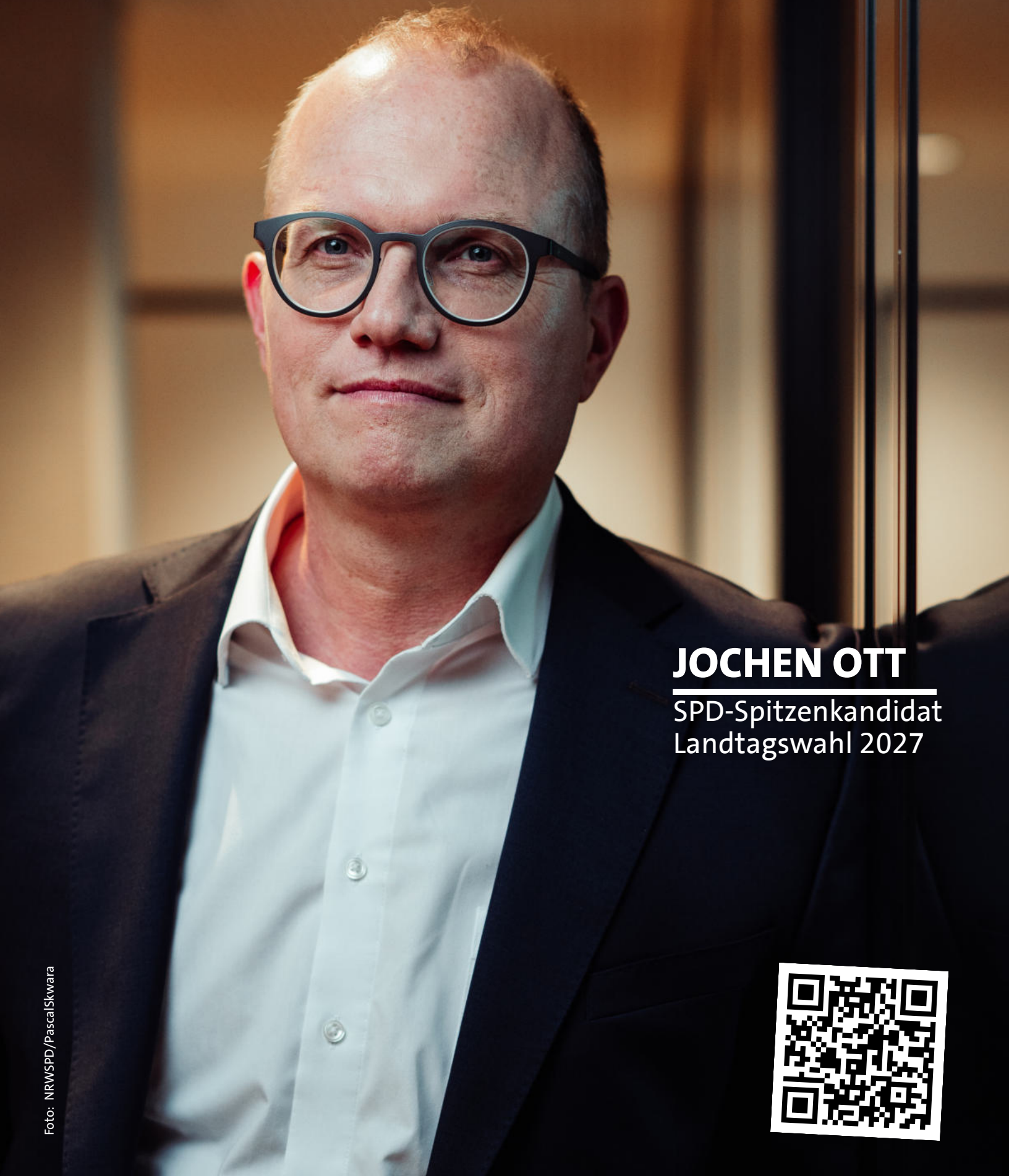
JOCHEN OTT SPD-Spitzenkandidat Landtagswahl 2027